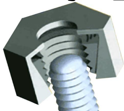
サンクイックナット