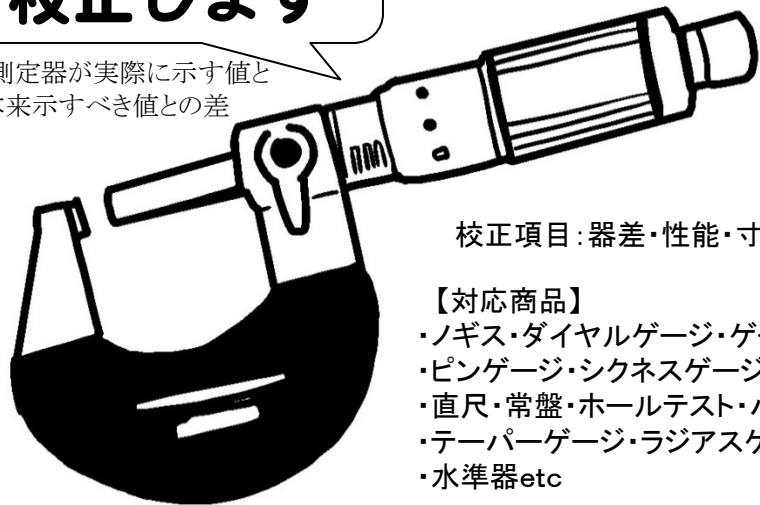
マイクロメーター